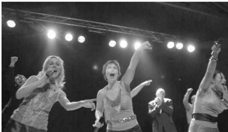
TOPP SHOW: Torsdagens konsert ble et møte med et vokalsemble i internasjonal toppklasse - og Apes & Babes fikk da også publikum med på notene...

– Vår beste konsert så langt på hele turneen! Et topp publikum,